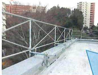
上記措置が 困難な場合