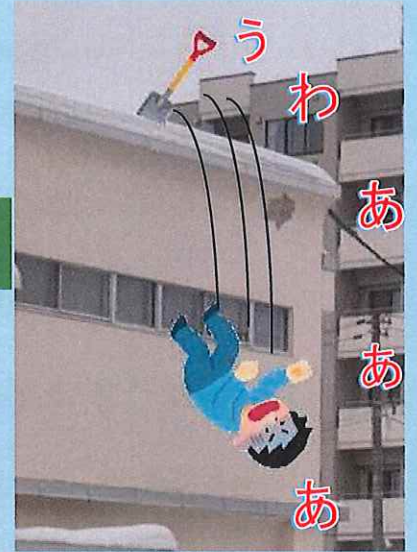
雪下ろし中の墜落