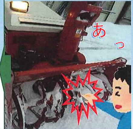
除雪機の刃部との接触