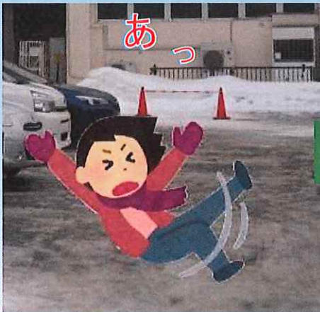
積雪・凍結路面での転倒