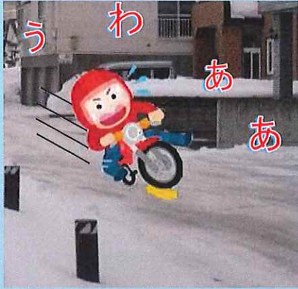
凍結路面での交通事故